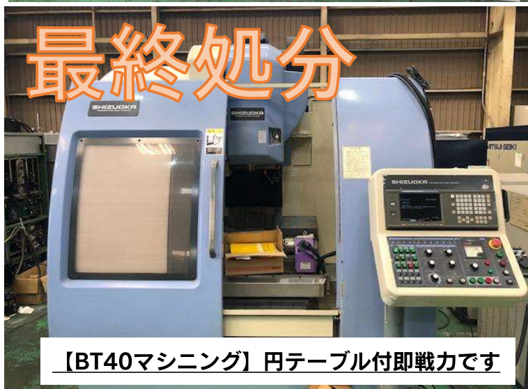
【BT40マシニング】円テーブル付即戦力です