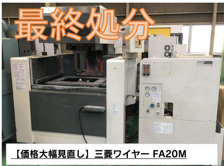
【価格大幅見直し】三菱ワイヤー FA20M