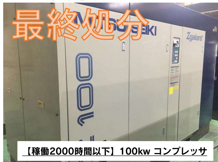
【稼働2000時間以下】100kw コンプレッサ